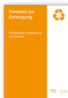
Hinweise zur Entsorgung