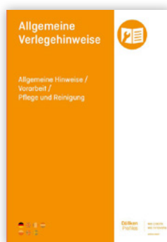
Allgemeine Hinweise / Vorarbeit / Pflege und Reinigung