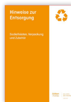
Notes on Disposal