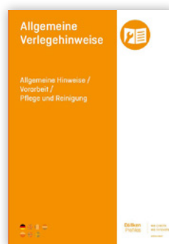
General installation instructions / Preliminary work / Care