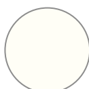
1132 weiß (RAL 9010)