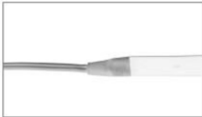
Spojení LED pásku s kabelem

LED pásy pro lišty SLK50 a MIG činí působivé osvětlení během krátké doby. Pásy se snadno montují díky oboustranné lepicí pásce nebo našemu montážnímu systému – což vede k příjemnému atmosférickému prostředí.