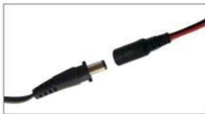
Připojení k napájení